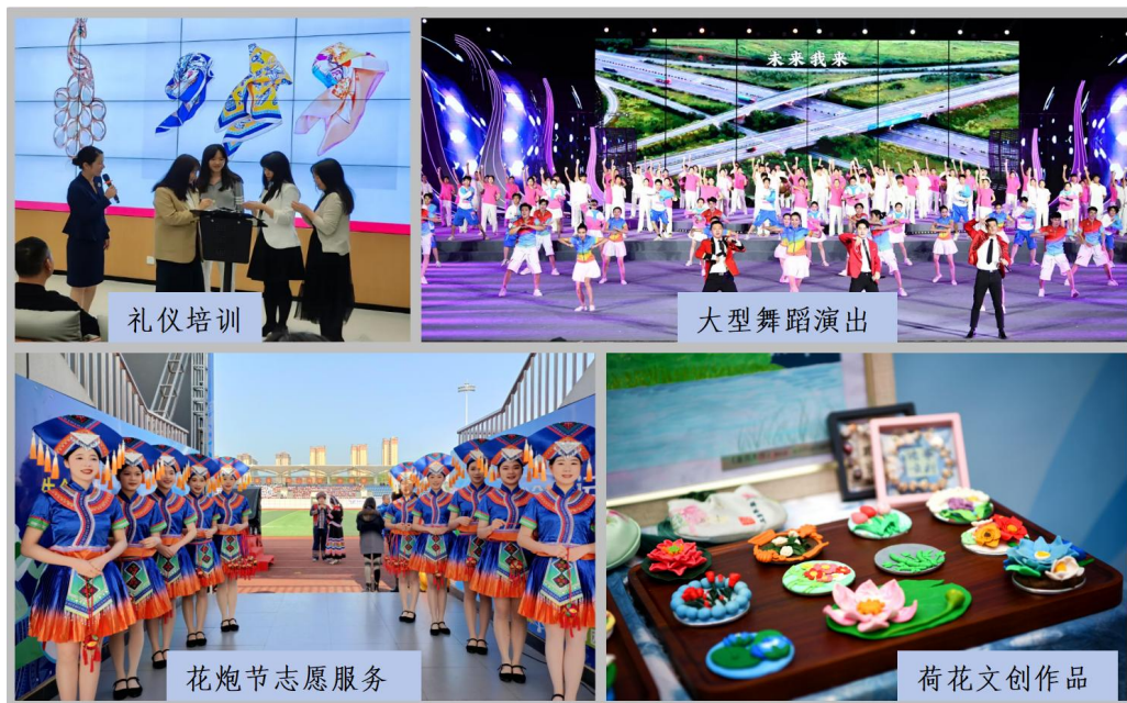
图1 旅校助力柳江区乡村振兴实践

多名学生志愿者现场提供引导、颁奖礼仪服务，这些专业又热情的身影，慢慢让“柳江旅游礼仪”成了当地的一张小名片。